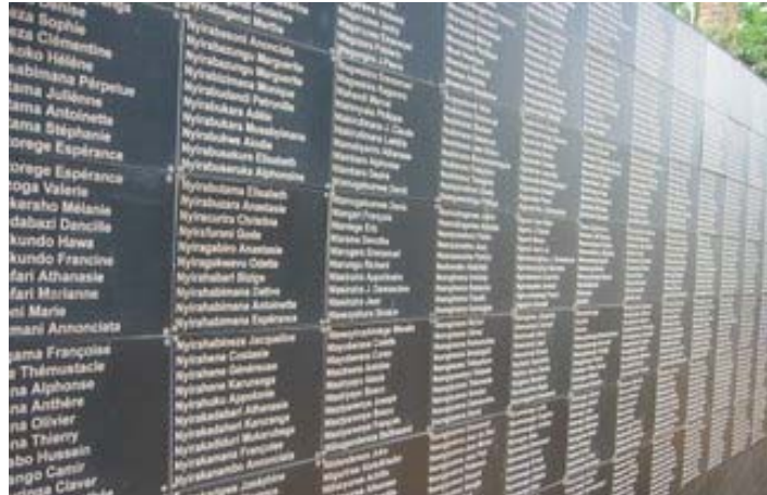
Az áldozatoknak állított emlékfal

Ennél sokkal több mindenről szólt 1994. Próbáltam minden oldalt megmutatni, mindenből egy keveset megvilágítani, hogy az olvasónak legyen kedve utánajárni és megismerni Ruanda kegyetlen történéseit. Sajnos nem sikerült túl sok irodalmat találni a témában de az előadás, az ajánlott irodalom és egy zseniális film birtokában és egy kiváló vendégelőadó által talán sikerült valamennyire átfogó képet mutatni Ruandáról és az ott zajlott eseményekről.